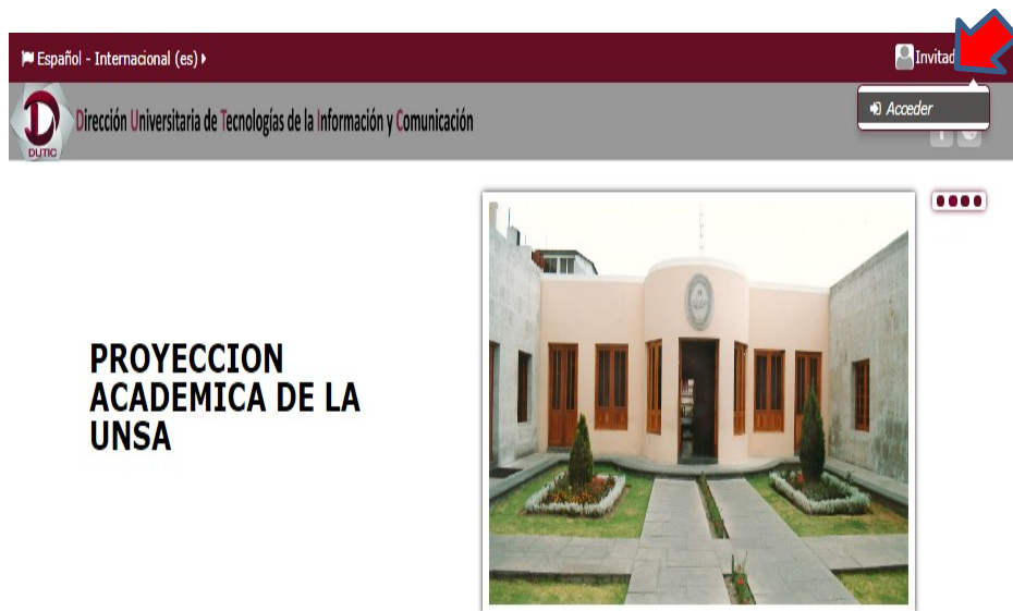
Figura 1: Página para acceder al Aula Virtual