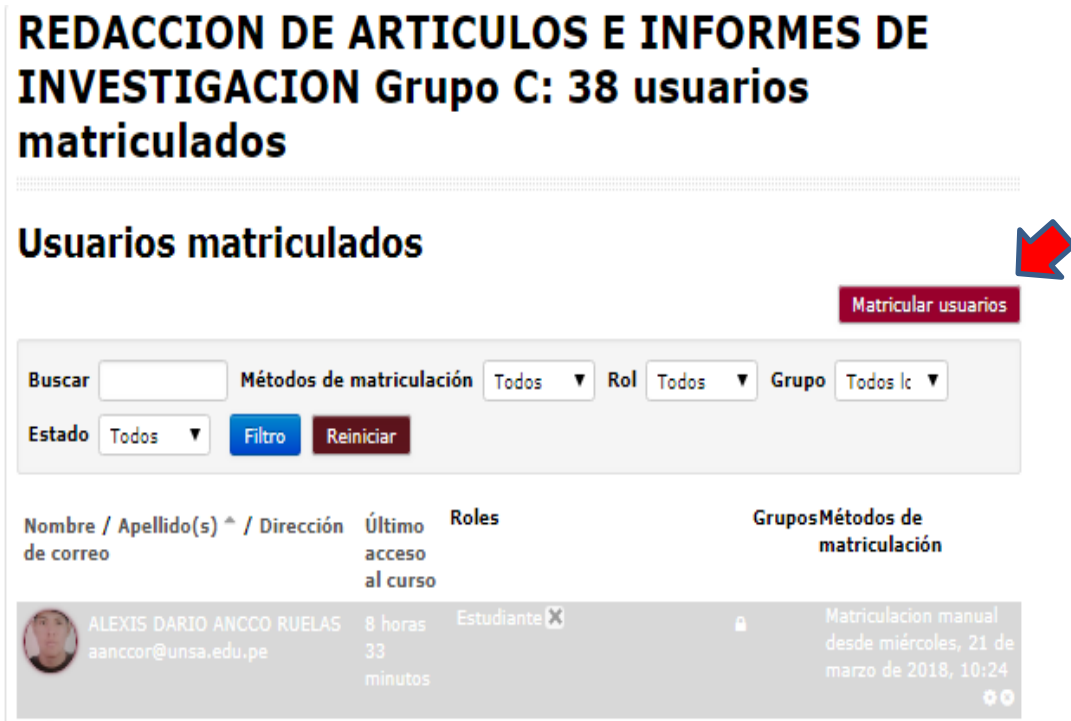
Figura 5. Ventana para Matricular Usuarios