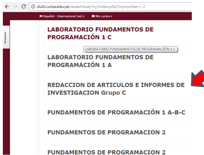
Figura 3: Lista de Cursos en el Aula Virtual

3. A usted se le mostrará la lista de sus cursos disponibles (Tal como se muestra en la Figura 3). Seleccione (dando doble Click ) el curso en el que quiere matricular alumnos ( Por ejemplo en este tutorial agregaremos alumnos al curso REDACCION DE ARTICULOS E INFORMES DE INVESTIGACION – GRUPO C).