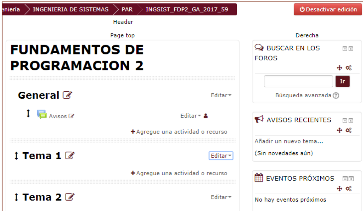
Figura 2. Ventana Principal del Curso : Modo Edición

2. A usted se le mostrará la misma ventana pero ahora con opciones de Edición (Figura 2).