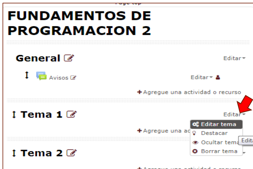
Figura 3 Ventana Principal del Curso – Editar Tema

3 Para ingresar la información, a la derecha de cada Tema usted encontrará la opción Editar -> Editar tema (Figura 3)